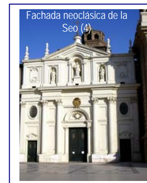
Fachada neoclásica de la Seo (4)