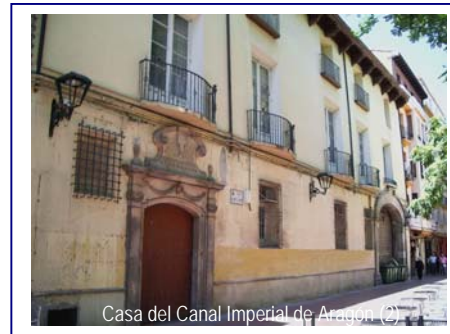
Casa del Canal Imperial de Aragón (2)