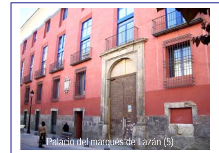
Palacio del marqués de Lazán (5)