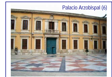
Palacio Arzobispal (6)