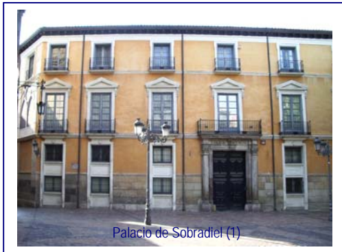
Palacio de Sobradiel (1)