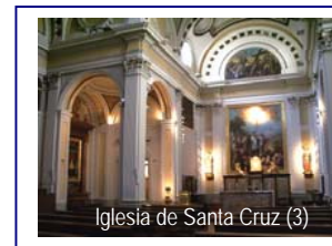
Iglesia de Santa Cruz (3)