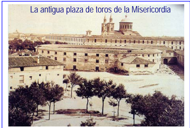
La antigua plaza de toros de la Misericordia

En el terreno del ocio cabe reseñar la inauguración del nuevo teatro en 1799, el que fue llamado más tarde "Principal", que sustituía al que había ardido la noche del 12 de noviembre de 1778 y que estaba situado contiguo al Hospital de Nuestra Señora de Gracia como puede observarse en el grabado de la izquierda. La plaza de toros se construyó a partir de 1764 para financiar a la Casa de Misericordia, que fue la institución de acción social más importante de la ciudad durante el cambio de siglo. Permanece en la actualidad su nombre originario de "Coso de la Misericordia". Tenía cabida para unos 8.000 espectadores y en ella se vieron faenas de diestros inmortalizados por Goya en su serie de grabados de "La Tauromaquia". También hubo espectáculos de equitación, doma de caballos y ascensión de un globo aerostático en 1784.