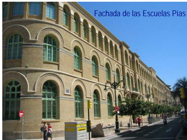
Fachada de las Escuelas Pías

Tanto el Hospital de Huérfanos como el Hospital de Nuestra Señora de Gracia fueron centros de enseñanzas profesionales con vistas a la reinserción social, preferentemente de manufacturas textiles, con unas condiciones de internamiento y de correctivos muy severos. El antiguo Hospital de Nuestra Señora de Gracia estaba situado en el lugar que ocupa actualmente el Banco de España en la plaza España y fue destruido por los bombardeos franceses durante los sitios.