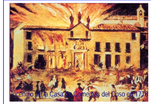
Incendio de la Casa de Comedias del Coso en 1778

Francisco Javier García, apodado El Españolito, trajo las novedades musicales italianas en 1756, año en el que se convirtió en maestro de La Seo y compositor. Falleció en 1809, durante el segundo sitio. El ámbito artístico se completa, ineludiblemente, con la obra de Francisco de Goya en el Pilar y en la Cartuja de Aula Dei , realizada entre 1771 y 1781.