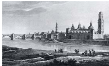
Vistas de Zaragoza de 1806. Desde la arboleda de Macanaz (izquierda) El monasterio de Sta. Engracia desde el Huerva (derecha)