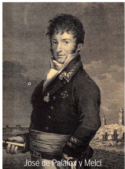
José de Palafox y Melci